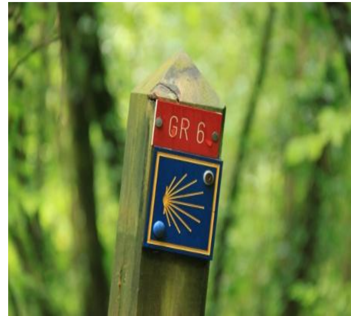
La coquille Saint-Jacques : symbole général du chemin de Saint Jacques de Compostelle avec le logo européen.